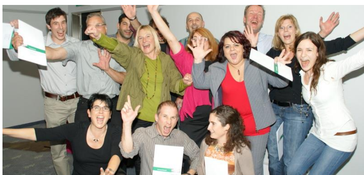
Die Zertifikate der Lernwerkstatt Olten sind auf dem Arbeitsmarkt bekannt und angesehen.