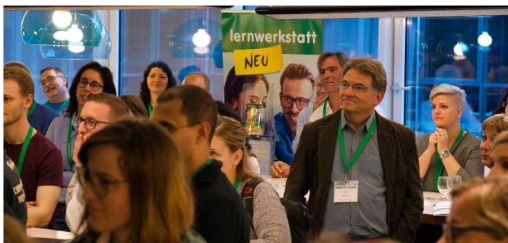
Inspirationen für Führung, Coaching und Mentoring am jährlichen Coaching-Mentoring-Event. www.coaching-mentoring-event.ch

Zertifikat «Ressourcenorientiertes Coaching» der Lernwerkstatt Olten